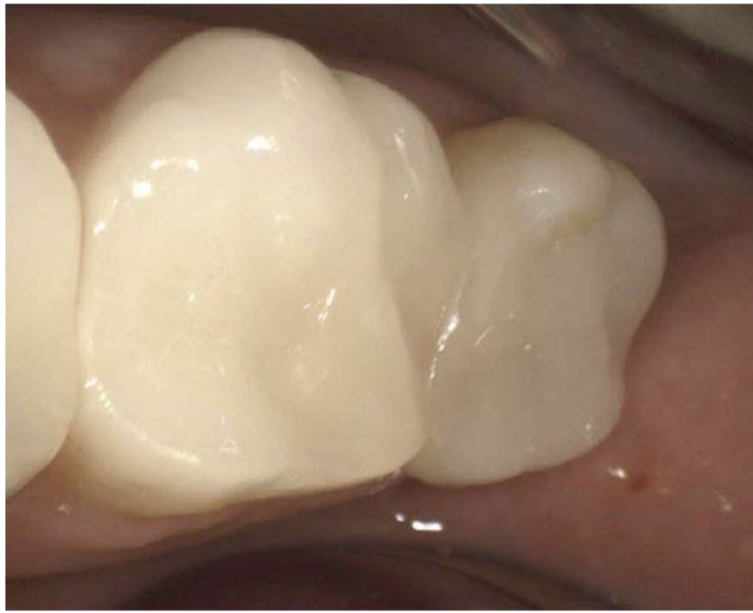
Hochwertige Keramikversorgungen an den gleichen Zähnen mit zumeist langer Haltbarkeit.