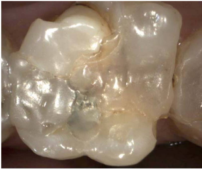
Ältere Kunststofffüllung, die mehrfach verschiedenseitig ausgebessert wurde.

Komplette Zahnsanierungen sind zwar oft kostenintensiv, jedoch nur auf den ersten Blick. Dr. Theodor Waldhorn berichtet, warum dies so ist und wie neuestes Equipment zu einem optimalen Ergebnis beiträgt.